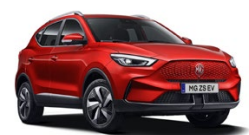
Červená - Diamond Red (metalická) 15 000 Kč