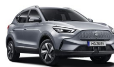
Stříbrná - Cosmic Silver (metalická) 15 000 Kč