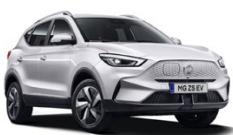
Bílá - Dover White