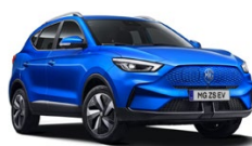
Modrá - Como Blue (metalická) 15 000 Kč