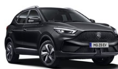
Černá - Pebble Black (metalická) 15 000 Kč